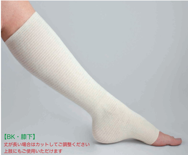
製品形状のイメージ図