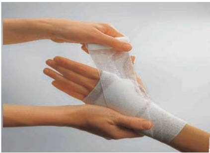
伸縮率 約100% ビスコース56% ポリアミド44%