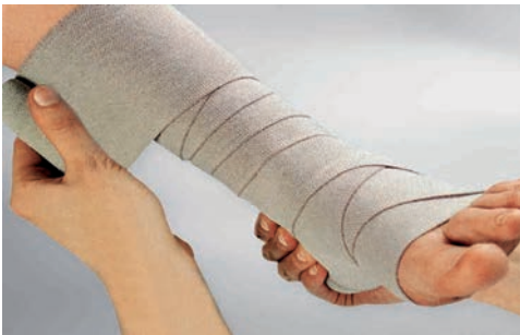
伸縮率 約90% コットン 100%