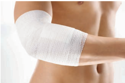
伸縮率 縦:約65% 横:約50% ビスコース66% ポリアミド34%