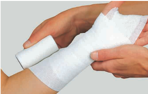
伸縮率 90% コットン 64% ポリアミド 34% ポリウレタン 2%