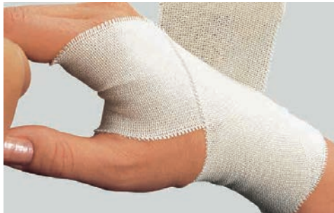
伸縮率 約90% コットン 100%