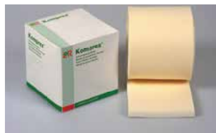
合成ラテックス製