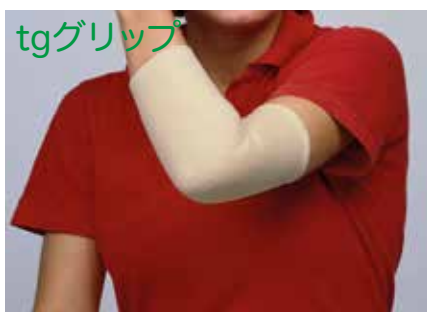
コットン85% ナイロン エラストジェン(ラテックス)

※ メートル販売につきましては、ご注文の際、品番のほかに「メートル数」を必ずご明記ください。伸縮性のある素材のため縮むなどの多少の寸法変化があります。