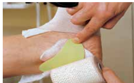
合成ラテックス製