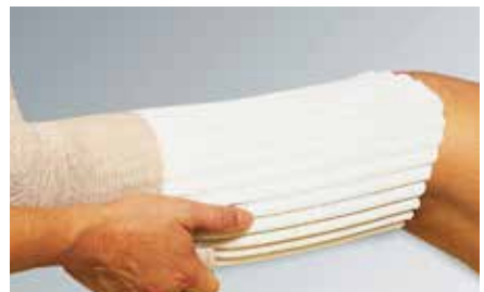
合成ラテックス製