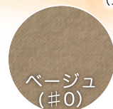
つま先無 (シングルボーダー)