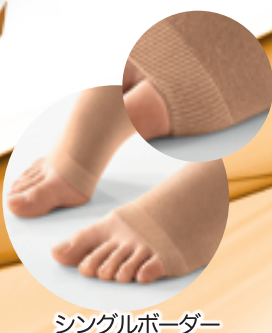
シングルボーダー